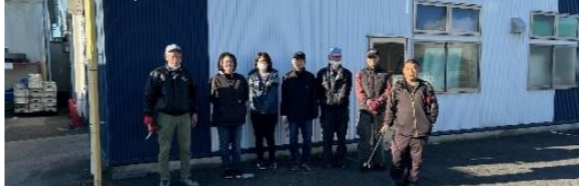
11/23工場周り清掃 今年最後の清掃スイ ミー・レンフロ・リリースの皆さんご苦労様でした