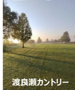
渡良瀬カントリー