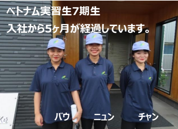
ベトナム実習生7期生 入社から5ヶ月が経過しています。

(株)サンケイ 社内情報誌 VOL15 No.12 発行元 総務課 創刊 H22. 2. 8